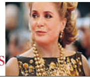
Catherine Deneuve actriz 67