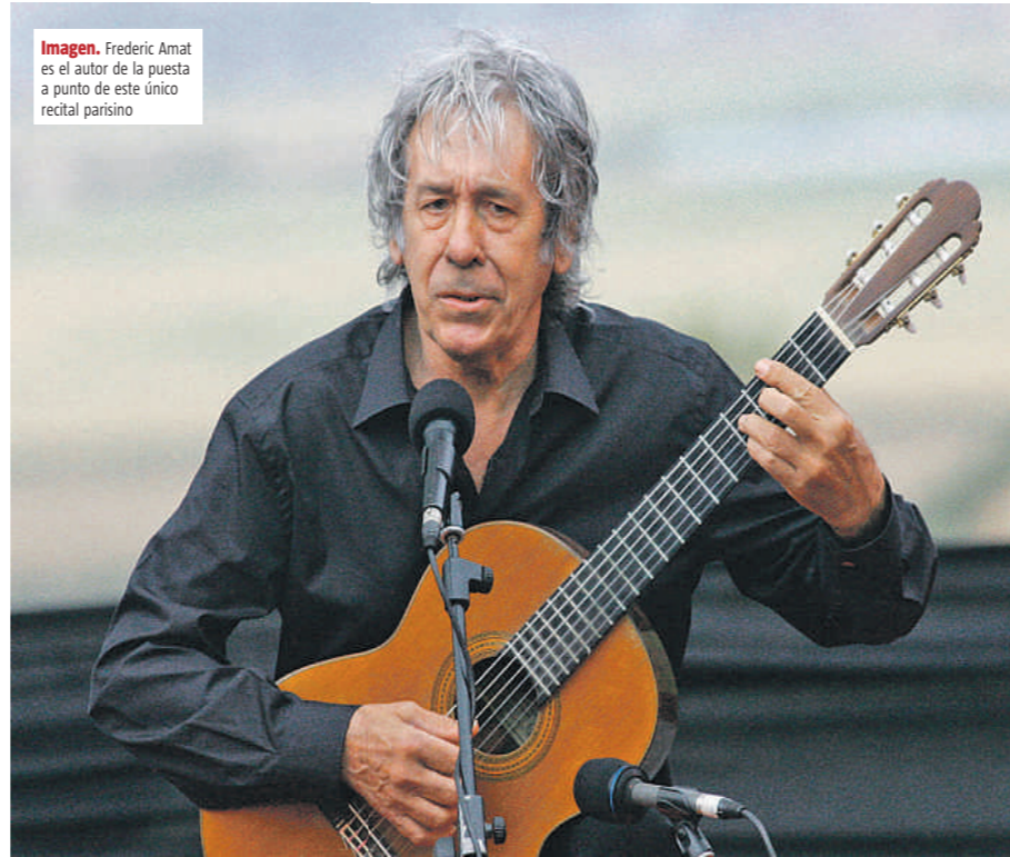
Imagen. Frederic Amat es el autor de la puesta a punto de este único recital parisino