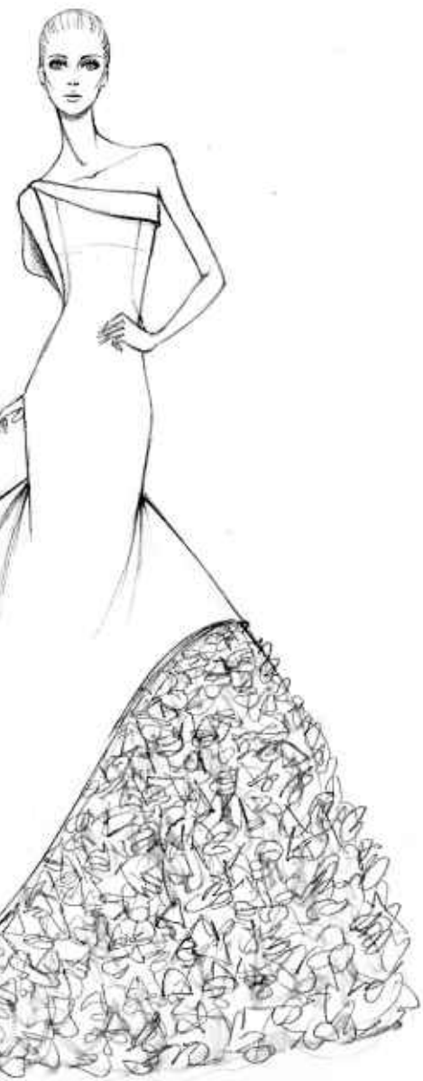
ROSA CLARÁ Y PRONOVIAS

Fernando Trueba dirigirá al 'marido de la peluquera' en un 'biopic' del artista francés, en el que Claudia Cardinale interpretará a su esposa