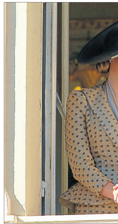
Alberto II y su prometida, Charlene Wittstock

Y muy a su pesar, quien desde el 19 de noviembre del 2005 es oficialmente Alberto II, "su alteza serenísima, príncipe soberano de Mónaco", comprobó en junio pasado que el anuncio de su noviazgo con la ex nadadora sudáfrica Charlene Wittstock y la cambiante fecha de boda eran la única información sobre Mónaco que interesaba al mundo.