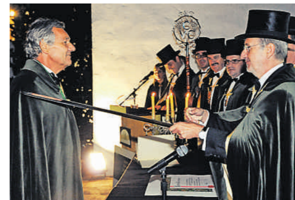
El embajador de Bélgica, investido cofrade del cava por Pere Bonet

Fatima al Sennusi, esposa del rey Idris I de Libia, con quien se casó en 1930 cuando él era Mohamed Idris al Sennusi, príncipe de la Cirenaica, murió el pasado día 3 en El Cairo a la edad de 98 años. El monarca reinó desde 1951 hasta 1969, cuando fue depuesto por un golpe militar encabezado por el coronel Gadafi. El soberano depuesto pasó el resto de su vida en Egipto y murió en El Cairo en 1983. En ese país, el matrimonio vivió bajo la protección del presidente de la república.