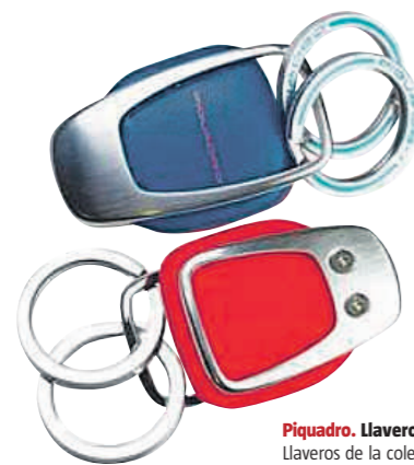
Piquadro. Llaveros Llaveros de la colección Frame de piel y acero de colores vivos de diseño moderno y funcional. 25 €