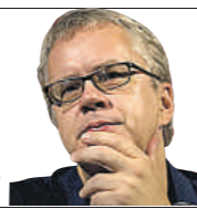
Tim Robbins actor 50