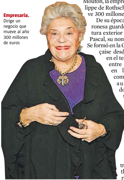
Empresaria. Dirige un negocio que mueve al año 300 millones de euros

ÓSCAR CABALLERO París Servicio especial Es un torbellino de carcajada estridente y voz ronca, que vivió dos o tres vidas pero que pudo haberse hecho humo, literalmente, a los once años, cuando su madre fue deportada por los nazis y a ella la dejaron: uno de los dos agentes