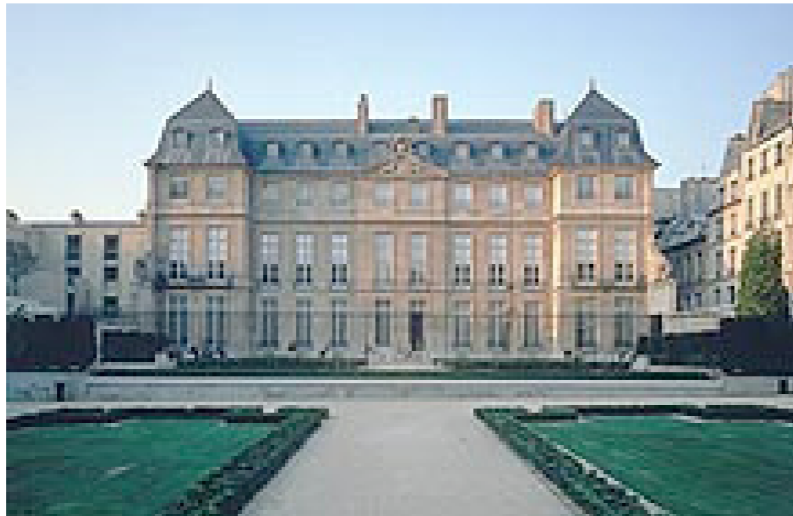
El Musée Picasso, de París

El museo, fruto de la dación de 1979 de la familia, posee 5.000 obras de Picasso, 3.000 de ellas frágiles, de papel, como el carnet N° 63, de la vitrina 9 del primer piso, estancia partida en dos por un espejo firmado Daniel Buren, que, junto a una cámara distraída, habría facilitado la tarea del caco: nadie sabe si el cuaderno desapareció el lunes o el martes. Se ignora también si la cerra-