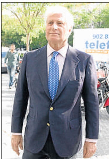
Carlos Fitz-James Stuart

Ignacio González, el presidente de la Comunidad de Madrid, declaró hace unos días que aparentemente los sucesores de la duquesa deberían liquidar el impuesto de sucesiones en la capital de España. De hecho, la duquesa estaba oficialmente empadronada en el palacio de Liria, y la casi totalidad