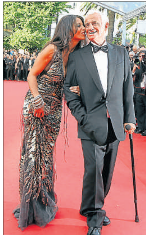
El actor y su mujer, en Cannes en el 2011

Si se exceptúa la disminución física, secuela del ictus que sufrió en el 2001, Bebel es el parisino de siempre. Reacio a las proyecciones privadas, pero gran cinéfilo, es raro no cruzarlo en alguna sala. O en una brasserie, donde lo normal es que le acompañe un superviviente de su banda del conservatorio (Jean-Pierre Marielle, Jean Rochefort...).