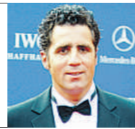
Hace 13 años (1996)

Declaraciones realizadas durante su visita a León para recoger el premio Leteo 2009