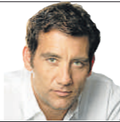
Clive Owen actor 46