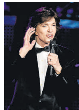
Sesto, el viernes en Madrid

ministra de Australia), han confesado haber sucumbido a los encantos de este sencillo pero adictivo juego para móviles con pantalla táctil. Angry birds es un juego creado por la compañía finlandesa Rovio protagonizado por unos simpáticos y vengativos pájaros que quieren eliminar a los crueles cerdos verdes que han robado sus huevos, lanzándose sobre ellos con la ayuda de un enorme tirachinas. El juego está desarrollado para el iPhone y el iPod Touch de Apple.