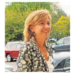
La infanta, en Washington

La infanta Cristina, que reside en Washington, ha inaugurado en la capital de Estados Unidos la exposición fotográfica Maternidades , organizada por la Fundación La Caixa, de la que doña Cristina es directora de su área internacional. La muestra,