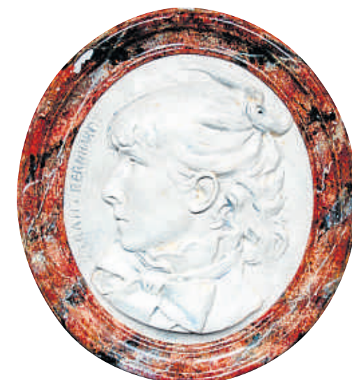
Medallón que Louise Abbéma dedicó a la actriz