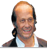
Paco de Lucía guitarrista 63