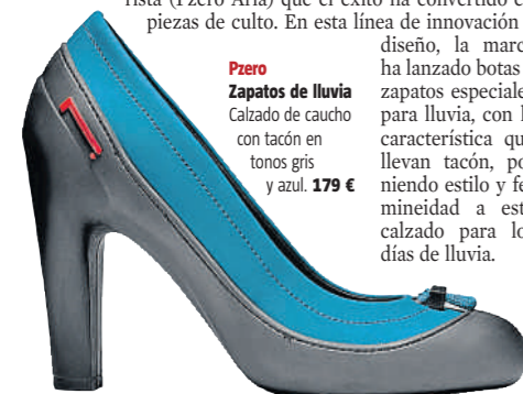
Pzero Zapatos de lluvia Calzado de caucho con tacón en tonos gris y azul. 179 €

Hace unos años la marca de neumáticos Pirelli decidió lanzar una línea textil y de calzado bajo el nombre de Pzero. Se trataba de un proyecto experimental, pues era aplicar el caucho a la ropa y los zapatos. Las dos primeras piezas, fueron unas zapatillas náuticas (Pzero Acqua) y una cazadora muy futurista (Pzero Aria) que el éxito la convirtió en piezas de culto. En esta línea de innovación y diseño, la marca ha lanzado botas y zapatos especiales para lluvia, con la característica que llevan tacón, poniendo estilo y femineidad a este calzado para los días de lluvia.