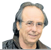
Joan Manuel Serrat cantautor 67

FAMOSOS LUJO MODA DIVULGACIÓN ESTILO ARTISTAS CUMPLEAÑOS