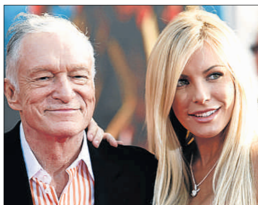
Hugh Hefner y su nueva novia, Crystal Harris

Injusto porque, por ejemplo, "los príncipes de Mónaco emprendieron campañas árticas para medir los efectos de la contaminación sobre las glacières, cuando nadie se preocupaba por la ecología". Y, de hecho, Alberto II se considera "el primer monarca que pisó ambos polos". De ahí la cabecera de uno de los ocho anuncios insertados a plena página en los principales periódicos de Francia e Inglaterra: "Principado de Mónaco, 12º bajo cero en verano y 47º bajo cero en invierno". En la presentación de la campaña, el príncipe explicó su encargo a la agencia TBWA-Paris, que la concibió: "Hacer evolucionar la percepción que se tiene de Mónaco; superar los tópicos; explicar