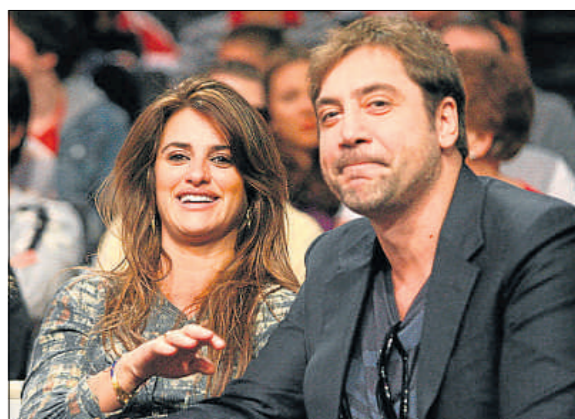
Pe y Bardem en el Staples Center, el día de Navidad

ban por sentado que en Madrid tienen todo previsto para el alumbramiento. A pesar de ello, y dado el avanzado de gestación de la estrella, es más que probable que Penélope renuncie a tomar cualquier vuelo antes del parto. La actriz madrileña tiene pendiente de estreno la cuarta entrega de Piratas del Caribe , y Bardem promoción Biutiful , el filme de González Iñárritu que le está proporcionando éxitos en todas partes. Algo muy distinto de su trabajo norteamericano más comercial, Come, reza, ama .