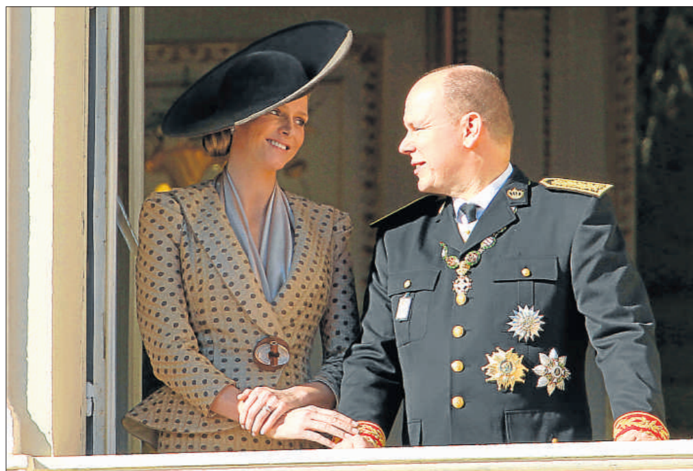
Alberto II y su prometida, Charlene Wittstock, con quien se casará el 1 de julio del año próximo, al aire libre

Pero también se casó con Grace Kelly, estrella de Hollywood, lo que orientó definitivamente los focos. Bien hecho: en 1982, Gracia muere en accidente de la ruta; ya, los paparazzi tenían trabajo con las peripecias amorosas de las princesas Estefanía -sobrevivió al accidente- y Carolina. En fin, el propio Alberto (52), tercer hijo de Rainiero y Grace Kelly, ahijado de Victoria Eugenia de España y reducido hasta entonces a las páginas deportivas, practicante primero y miembro del COI luego, reconoce sucesivamente dos hijos extramaritales.