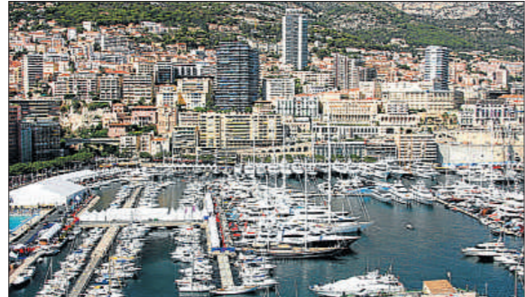
El International Yacht Show en el puerto de Montecarlo en el 2007

Y muy a su pesar, quien desde el 19 de noviembre del 2005 es oficialmente Alberto II, "su alteza serenísima, príncipe soberano de Mónaco", comprobó en junio pasado que el anuncio de su noviazgo con la ex nadadora sudáfricana Charlene Wittstock y la cambiante fecha de boda eran la única información sobre Mónaco que interesaba al mundo.