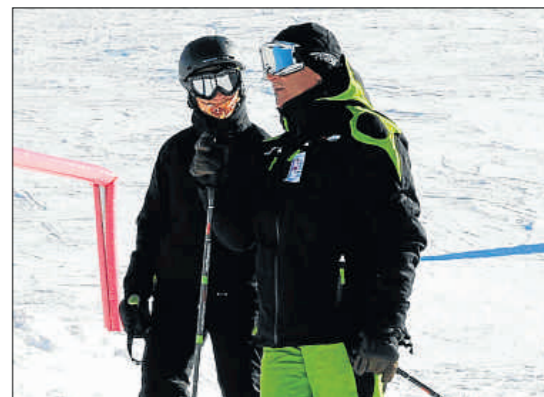
La infanta Elena, acompañada por un monitor, en Baqueira

Las hijas de los Reyes abandonaron la estación pasadas las dos de la tarde y no hubo comida familiar en ninguno de los restaurantes de la estación. Sí que se vio a la infanta Elena reponiendo fuerzas, con menú de bocadillo, en la terraza del restaurante de la cota 1.800.