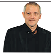
Jordi Rebellón actor 53