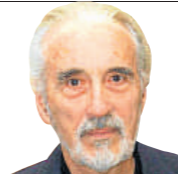
Christopher Lee actor 89

FAMOSOS LUJO MODA CANTANTES ESTILO ARTISTAS CUMPLEAÑOS