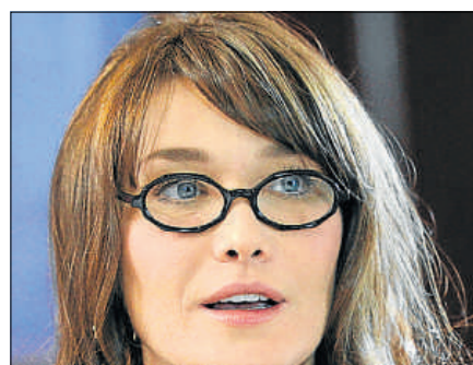
Será varón Se confirmó el sexo del bebé