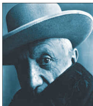
Picasso, el genio de nuevo a la palestra

Pero lo más interesante es el aluvión de testimonios sobre la generosidad del pintor -tantas veces negada- y de su viuda. La septuagenaria Geneviève Laporte, 17 años cuando conoció al Picasso de 69, y otros 17 años de amor, recuerda la tarde en la que dos obreros catalanes llamaron a la puerta del taller de la Rue des Grands Augustins, donde Picasso pintó el Gernika . "No entendí de