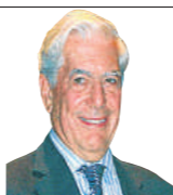
Mario Vargas Llosa escritor y Nobel de Literatura 75