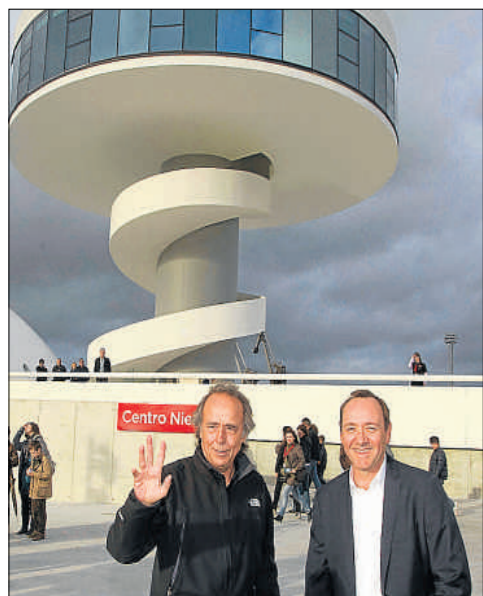
Serrat y Spacey, ayer frente al Centro Niemeyer de Avilés