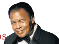
James Earl Jones actor 80

FAMOSOS LUJO MODA ACTRICES ESTILO ARTISTAS CUMPLEAÑOS