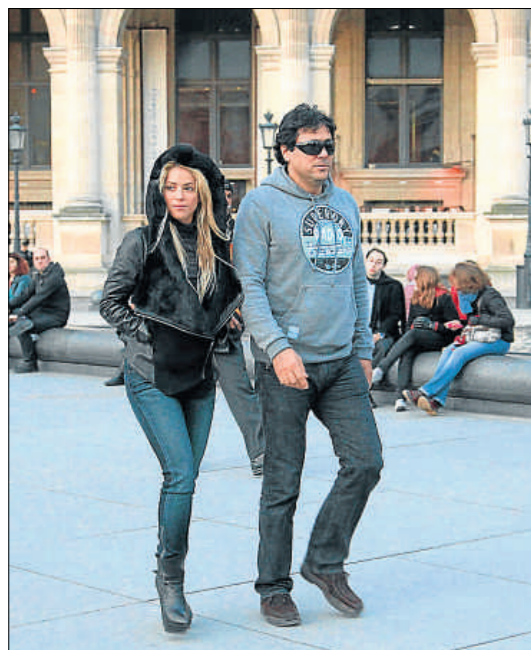
Shakira, el sábado en el Louvre, con uno de sus hermanos