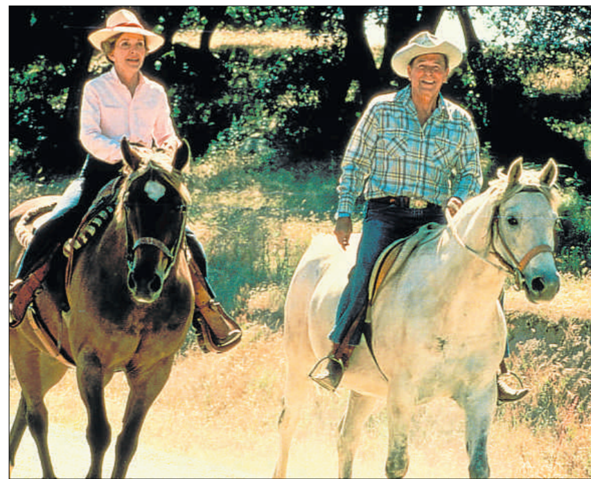
En el rancho. Ronald Reagan y su esposa Nancy, que con 89 años aún le sobrevive, en una foto tomada en El Rancho del Cielo, situado en Santa Bárbara (California)

Antes de interpretar a esa improbable reina de una Inglaterra inexistente -si la monarquía inglesa es de las más antiguas, sus primeros documentos son del siglo IX, cuando los galos eran ya recuerdo-, Deneuve participará, junto a su hija, Chiara Mastroianni, en el próximo filme de Christophe Honoré, cuyo título provisional es Les bien-aimés .●