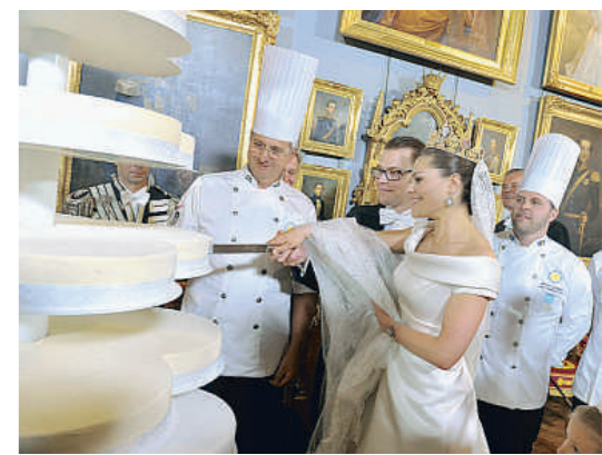
Once pisos y cien kilos de tarta que la pareja partió muy feliz

La última parte de la celebración de la boda de la heredera sueca y su príncipe Daniel fue la única privada, ya que ese gran hermano palaciego que permitió ver por televisión el desarrollo de la cena y el principio del baile posterior acabó a partir del segundo vals. En vivo y en directo se vivió, rozando la medianoche, el momento en el que los recién casados cortaron el pastel de bodas, una enorme torre de once pisos y cien kilos de peso, con varias tartas de azúcar glaseado blanco y azul que