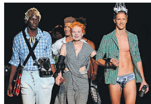
Vivienne Westwood, al final de su desfile entre dos modelos

SANTORAL Luis Gonzaga , Martín, Raúl, Rufino, Marcia, Apolinar, Eusebio, Terencio, Albano