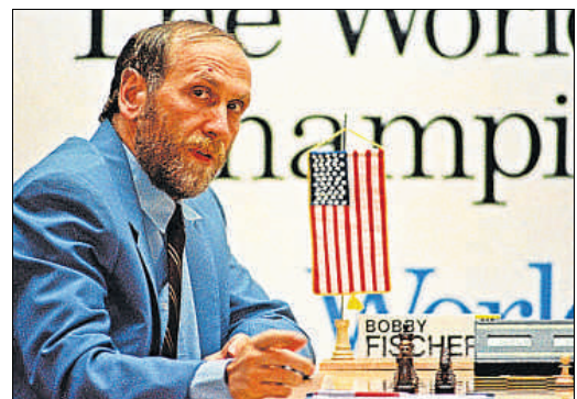
El campeón de ajedrez Bobby Fischer murió en enero del 2008