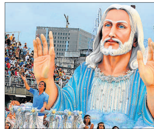
Vanderlei Almeida / AFP

El brasileño Roberto Carlos se convirtió en la estrella de la segunda y última noche de desfiles oficiales del carnaval de Río. El cantante apareció en lo alto de una carroza de la escuela de samba Beija-Flor, que lo homenajeó con la alegoría "La simplicidad de un Rey", con motivo de sus casi setenta años y más de cincuenta de carrera musical. El artista recibió una gran ovación y acompañó algunos de sus propios temas, que resonaban en el Sambódromo. / R. Mur