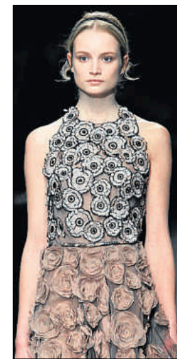
Valentino, la mujer en flor