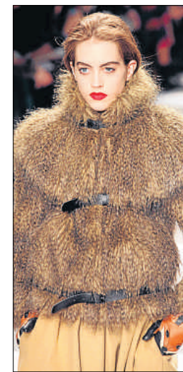
Castelbajac, ideal para el frío