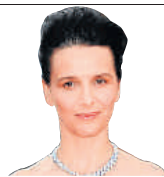
Juliette Binoche, actriz 47

FAMOSOS LUJO CINE REALEZA ESTILO ARTISTAS CUMPLEAÑOS