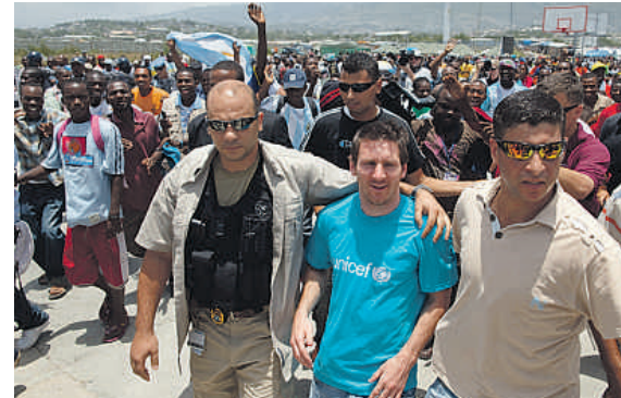
Leo Messi junto a sus guardaespaldas en Haití el jueves pasado

Leo Messi ha jugado esta semana un "importante partido" como embajador de Unicef durante una visita a Puerto Príncipe (Haití), donde se ha encontrado con niños víctimas del terremoto que el pasado 12 de enero azotó el país caribeño. En su visita recorrió un campamento donde viven 50.000 haitianos que perdieron sus hogares, además de haber sido explotados y maltratados. El jugador del FC Barcelona conversó con los niños y niñas que participan en un programa de actividades deportivas. / Efe