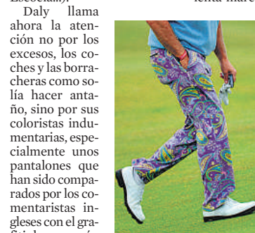
Los pantalones de Daly

Tiger Woods no es el único pecador entre las élites del golf. Ahí está su compatriota John Daly (44), que ha vuelto a brillar en los épicos greens de Saint Andrews con ocasión del Open británico, con 35 kilos menos de los que solía llevar auestas y sin probar una gota de alcohol (ahora bebe leche, un cambio revolucionario para un hombre que era capaz de acabar en una noche con las reservas de whisky de Escocia...).