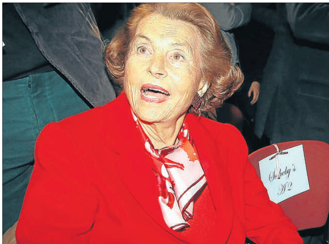
Liliane Bettencourt (88) es la accionista mayoritaria de L'Oréal y su fortuna personal es de 16.000 millones de euros

Arnault, con sus 41.000 millones de dólares -único europeo, con Amancio Ortega, el creador de Zara- entre los diez primeros de Forbes , puede ser disculpado. ¿Cómo creará que hay una crisis