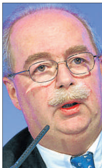
CHRISTOPHE DE MARGERIE Presidente de Total 3.000.000 € (2010)