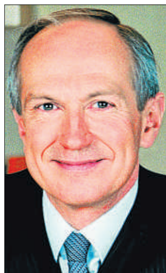
JEAN-PAUL AGON Presidente de L'Oréal 3.800.000 € (2010)