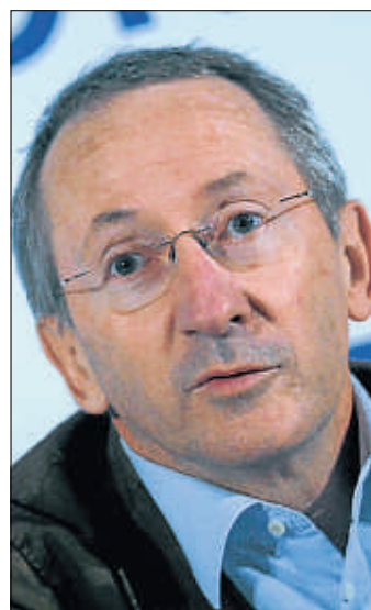
FRANK RIBOUD Presidente de Danone 2.900.000 € (2010)