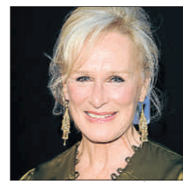
Glenn Close, el pasado junio

Glenn Close, cinco veces candidata al Oscar, recibirá en septiembre el premio Donostia del festival de San Sebastián en reconocimiento a su carrera. La actriz (64) será homenajeadada el 18 de septiembre con ocasión de su visita a la capital donostiarra para presentar su última película, Albert Nobbs –en la que hace un papel de hombre–, dirigida por Rodrigo García, y que se proyecta fuera de concurso en la 59.ª edición de la principal cita cinematográfica de España. ●