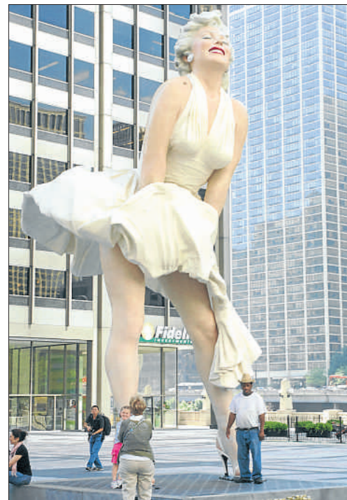
La figura de Marilyn de ocho metros erigida en Chicago