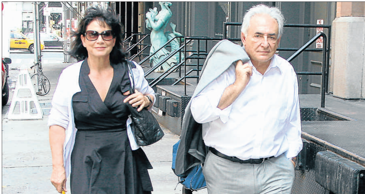
El matrimonio formado por Anne Sinclair y Dominique Strauss-Kahn, fotografiado en Nueva York, una vez que el ex presidente del FMI dejó la prisión

Entre 1984 y 1997, por ejemplo, su cita semanal en la televisión francesa, por la que desfilaron los grandes de la política y del espectáculo, llegó a congrega 12 millones de televidentes. Periodista formada entre Estados Unidos –nacido en Nueva York el 15 de julio de 1948– y París, debutante en la televisión francesa en 1976, casada con el periodista Ivan Levaí, padre de sus dos hijos, integrada en el círculo del presidente Mitterrand, fue sin discusión la número uno del periodismo audiovisual.