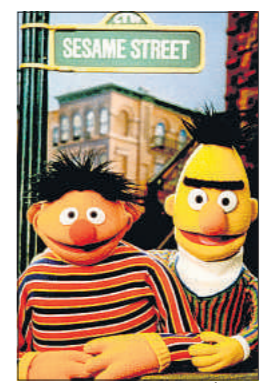
La famosa pareja de marionetas