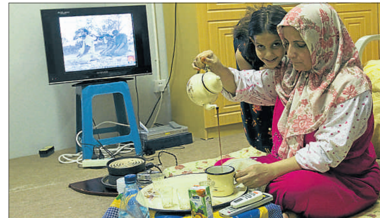
La televisión, muy presente cuando los musulmanes se alimentan en su mesac

Glenn Close, cinco veces candidata al Oscar, recibirá en septiembre el premio Donostia del festival de San Sebastián en reconocimiento a su carrera. La actriz (64) será homenajeadada el 18 de septiembre con ocasión de su visita a la capital donostiarra para presentar su última película, Albert Nobbs –en la que hace un papel de hombre–, dirigida por Rodrigo García, y que se proyecta fuera de concurso en la 59.ª edición de la principal cita cinematográfica de España. ●