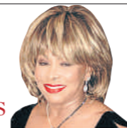
Tina Turner cantante 72