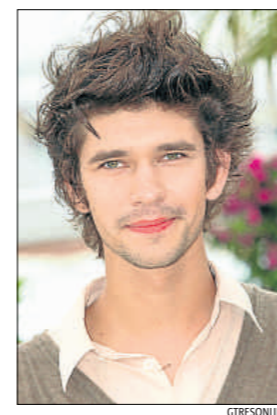
Whishaw inventará los artefactos