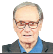
Ennio Morricone compositor 83