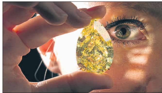
FABRICE COFFRINI / AF

El diamante amarillo Gota de Sol, que por su talla y pureza es único en el mundo, será la estrella de la subasta que el próximo martes celebrará Sotheby's en Ginebra. Con un peso de 110,3 quilates es el diamante en forma de pera y de color amarillo más grande que se conoce y su precio estimado está entre los 11 y 15 millones de dólares (entre 8 y 11 millones de euros). También se subastará un juego de collar, broche y pendientes de diamantes imperiales con un valor de 10 millones de dólares (7,3 millones de euros). Se cree que los diamantes pertenecieron a Catalina I de Rusia. / Efe