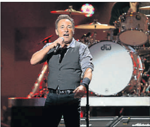
DAVE ALLOCCA / AP