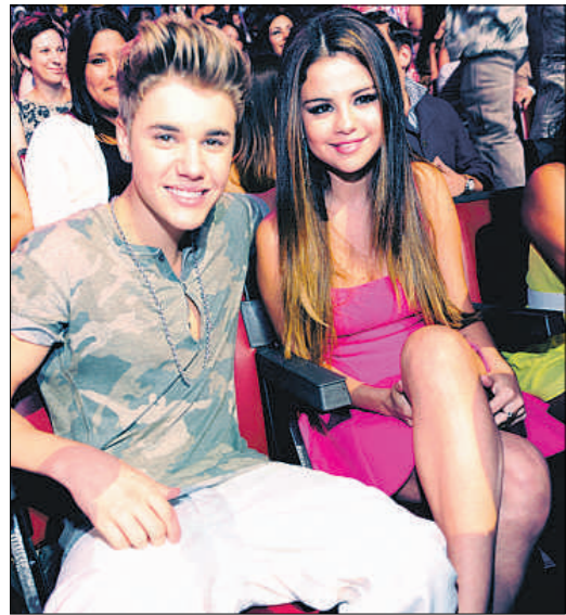
Justin Bieber y Selena Gómez, el pasado julio