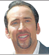
Nicolas Cage actor 49