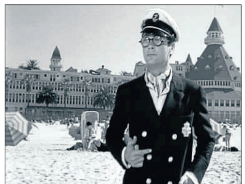
Con esa chaqueta, Curtis besó a Monroe en Con faldas y a lo loco

Una rápida mirada a los casi 500 lotes que saldrán a la venta revelan llamativas curiosidades sobre Curtis: como la enorme colección de libros, fotos y pósters que tenía sobre Marilyn Monroe, con quien compartió cartel en 1959 en el clásico de Billy Wilder Con faldas y a lo loco ; su fascinación por los relojes y los cigarrillos, y la gran cantidad de botas, gafas y sombreros que poseyó en vida. Además de una vasta colección de obras de arte en la que destacan sus propios cuadros, algunos jarrones realizados en