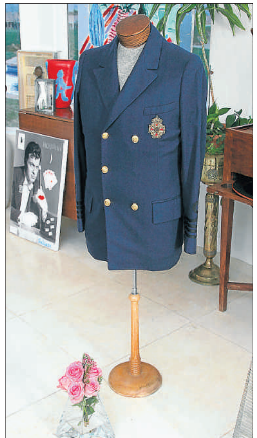
La chaqueta que lució el actor en Con faldas y a lo loco

El objetivo era obtener fondos para mantener su obra de beneficencia para rescatar ca-