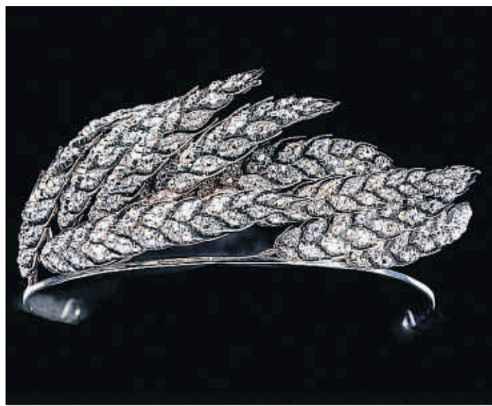
Una diadema de la joyería Chaumet expuesta en Las Jornadas