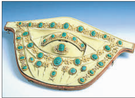
Aderezo de camafeos de malaquita