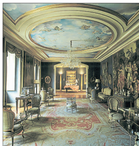
El salón de música del palacio de Liria, en el centro de Madrid