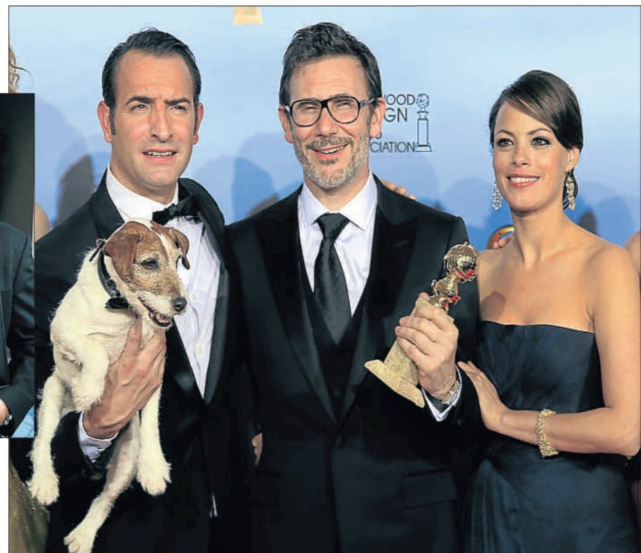
Jean Dujardin (con el perrito Uggie), Michel Hazanavicius y Bérénice Béjo; en la foto de la izquierda, Harvey Weinstein

En el palmarés del cofundador con su hermano Bob de los estudios Miramax, 287 nominaciones y 63 victorias, incluidos cuatro Oscar a la mejor película. Y entre sus pupilos , celebridades como