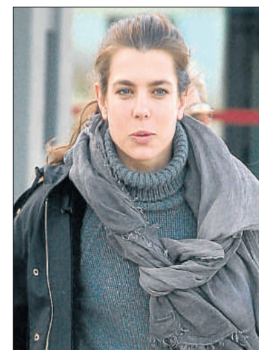
Carlota de Mónaco (izquierda) y Gad Elmaleh fotografiados hace unos días en París

Por eso, Dujardin remató su agradecimiento "con una cita de Douglas Fairbanks", icono del cine mudo. Es decir, que movió los labios sin decir palabra y desencadenó así las carcajadas que pueden llevarle, en volandas, al Oscar.●