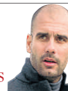
Josep Guardiola entrenador FC Barcelona 41