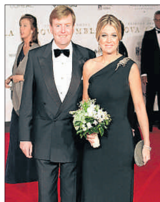
Guillermo y Máxima, a finales del 2011

desaparecida Diana de Gales -fallecida tras una persecución automovilística por parte de unos paparazzis precisamente en el puente d'Alma en París-, ha retomado la sensación de peligro físico a que se ve sometida Carlota. "Es un infierno cotidiano", ha finalizado el letrado.