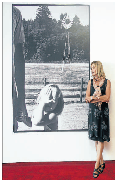
Jessica Lange posa junto a una de sus fotografías, en Avilés