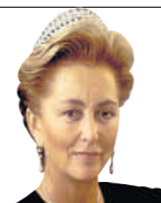
Paola de Bélgica, reina de los belgas 74