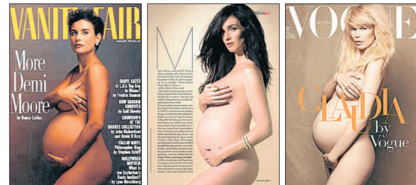
Demi Moore, Paz Vega y Claudia Schiffer han posado desnudas cuando estaban embarazadas