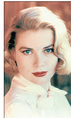
La princesa, en 1954

Baza importante, el guión del galés Arash Amel, que a sus 36 años se ha convertido en una figura de su oficio. En fin, como en promoción nada se pierde, la reacción palaciega servirá de rampa de lanzamiento al filme, en el que también tiene un papel Paz Vega, y cuyo estreno está previsto para finales del 2013 o primeros meses del 2014.