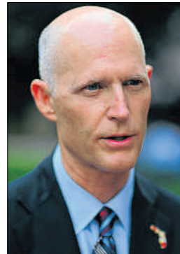
Rick Scott, el pasado día 10

Esta semana, el diario Tampa Bay Times decidió preguntarle directamente a Scott por el paradero del perro, después de tratar infructuosamente de obtener una respuesta por parte de su gabinete de prensa.