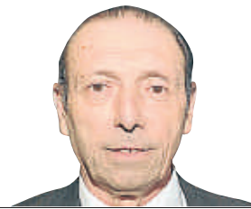
Enrique Castro, ‘Quini’

“La vida es una lucha continua. El que tiene una enfermedad lucha al máximo e intenta no dejarse llevar. Hay que olvidar los momentos malos y difíciles”