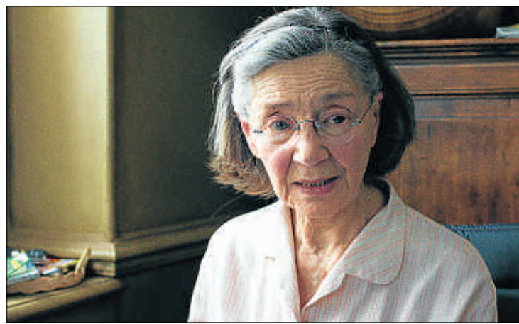
Emmanuelle Riva, en una escena de Amor

en un baúl. "Fotografiar es como escribir: tomas un trozo de realidad y lo transformas en imagen o en palabras. En 1958 desembarqué en Tokio con una Ricohflex; Resnais me refrescó las nociones básicas y pasé la semana libre que tenía antes del rodaje en un deambular continuo por Hiroshima, donde 13 años después de la bomba buena parte de la población vivía todavía en cabañas. Pero yo no pensaba en la bomba ni en ofrecer un testimonio; sola-