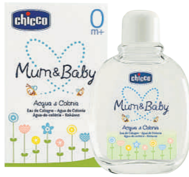
Chicco Mum & Baby Agua de colonia de aroma fresco y dulce pensada para que la usen madres y bebés 9 €

Los bebés en sus primeras semanas de vida reconocen a la madre por el olor. Chicco, la marca especializada en el cuidado de los niños, ha lanzado la nueva agua de colonia Mum & Baby, pensada para que la puedan usar tanto las madres como los recién nacidos y unir así más el lazo afectivo. Este nuevo aroma -con un envase de diseño divertido- es fresco y dulce y resulta ideal para utilizarlo después del baño. La colonia está avalada por el Instituto Dermatológico Europeo y es hipoalérgica.