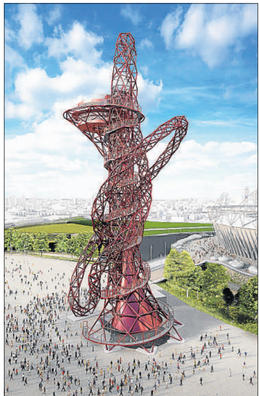
Imagen virtual de la torre ArcelorMittal Orbit, de 115 metros