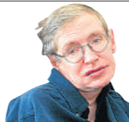
Stephen Hawking físico 69