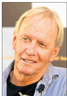
Paul Hogan, en el 2008

La obra incluirá dos plataformas internas de 300 m 2 que ofrecerán una vasta panorámica de la ciudad, así como restaurantes y un pabellón en la base de la estructura, con una exposición educativa. Los promotores creen que la torre, que se unirá a la lista de grandes monumentos como la torre Eiffel (324 m) o la estatua de la Libertad (93 m), podría atraer a un millón de visitantes al año, con unos ingresos de 10 millones de libras (unos 12 millones de euros).