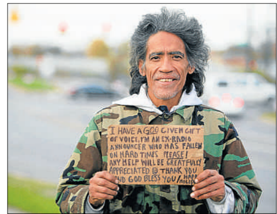
Con el cartel en el que dice "Dios me ha dado una voz de oro"

Por eso, si Bernard Le Coq, conocido imitador, es un impresionante Jacques Chirac, igual que el actor Samuel Labarthe se transfigura en un Dominique de Villepin calceado y Saïda Jawad aparece como una copia conforme de Rachida Dati, tanto en la Cecilia de Florence Pernel -madre de los dos hijos de Rotman, dos premios Molière en teatro- como en el Sarkozy de Podalydès emerge lo propio del buen actor, la composición del personaje.