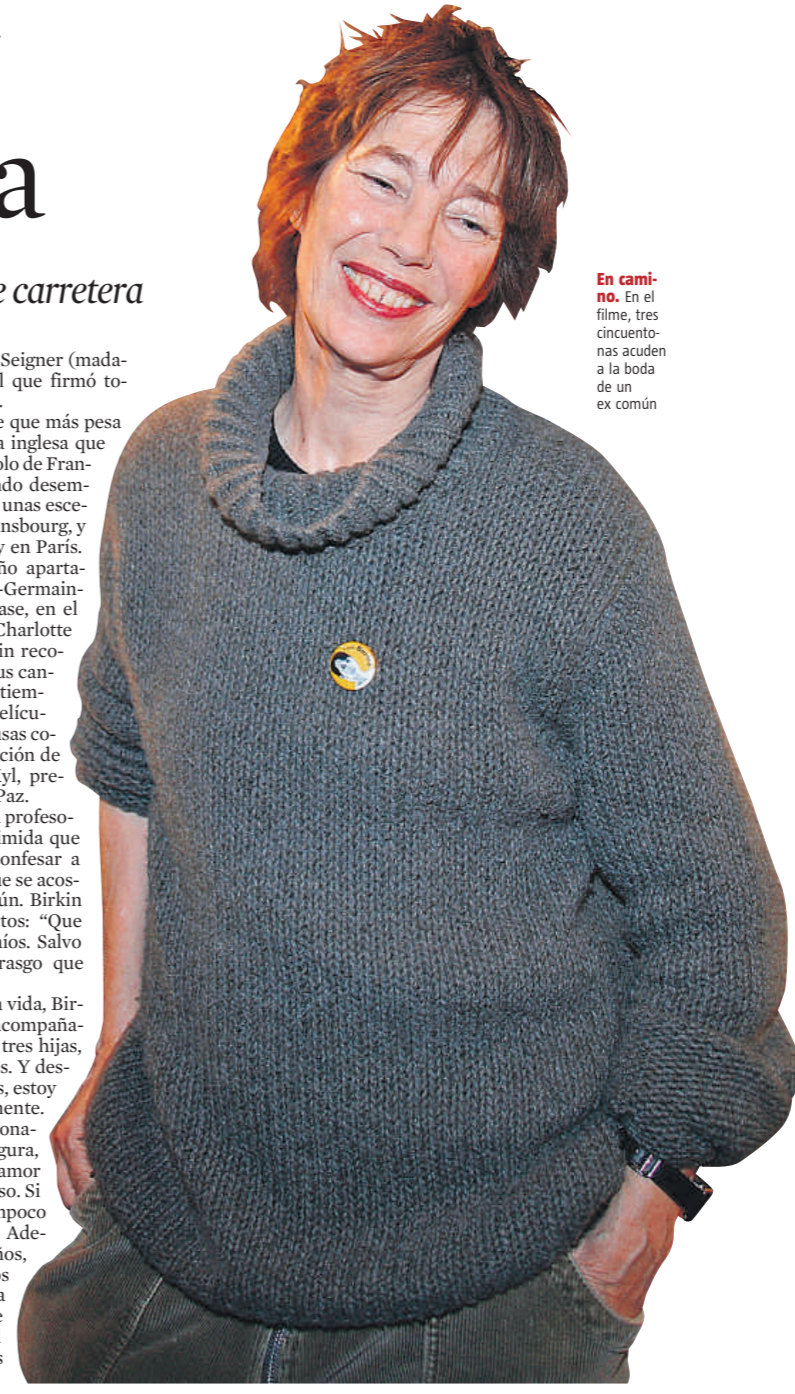
En camino. En el filme, tres cincuentonas acuden a la boda de un ex común

co de Emmanuel Seigner (madame Polanski), del que firmó todas las canciones. Pero el nombre que más pesa es el de Birkin, la inglesa que se convirtió en ídolo de Francia en 1969, cuando desembarcó para filmar unas escenas con Serge Gainsbourg, y se instaló con él y en París. Con su pequeño apartamento en Saint-Germain-des-Près como base, en el barrio de su hija Charlotte Gainsbourg, Birkin recorre Francia con sus canciones. Le queda tiempo para dirigir películas y defender causas como la de la liberación de Aung San Suu Kyi, premio Nobel de la Paz. Su Nelly es una profesora más bien reprimida que no se atreve a confesar a sus dos amigas que se acostó con el ex común. Birkin asume sus defectos: "Que pueden ser los míos. Salvo su avaricia, un rasgo que odio". Sin pareja en la vida, Birkin se dice bien acompañada. "Tengo a mis tres hijas, nietos y hermanos. Y desde hace siete años, estoy en gira permanente. Como soy apasionada, celosa e insegura, la euforia de un amor tiene su contrapeso. Si no hay amor, tampoco hay sufrimiento. Además, con 60 años, una piensa menos en sí misma. Ya no es el centro de la foto. En el centro están mis hijas".