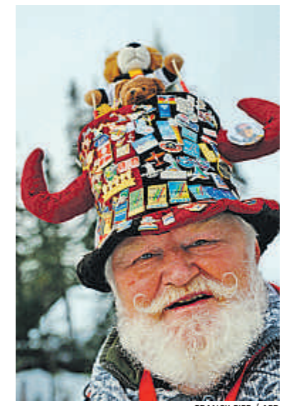
Un coleccionista en Vancouver

en sus 19 libros, así como meandros de su vida sentimental o compromisos políticos e ideológicos propios de un reportero procedente de un país comunista con censura imperante y libertad profesional y para viajar muy limitada y controlada. La juez estimó que Kapuscinski, en cuanto a personalidad pública, puede ser tema de discusión sin cortapisas y que muchos hechos de su vida ya son de dominio general. El tribunal consideró también que la honradez investigadora del biógrafo puede ser objeto de verificación, pero la viuda no ha convencido al tribunal acerca del supuesto atentado contra el buen nombre del reportero que supondría el libro.