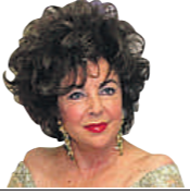
Elizabeth Taylor actriz 78