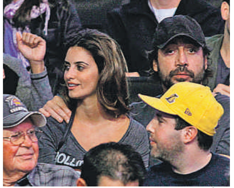
Penélope Cruz y Javier Bardem presenciando el partido