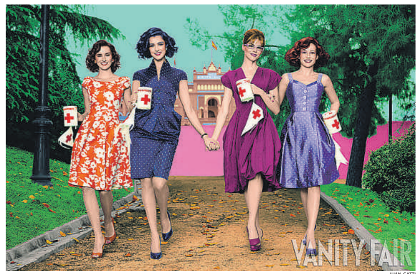
En 1958, las postulantes fueron Concha Velasco, Katia Loritz, Mabel Karr y Luz Márquez. Las han suplido para esta foto Marina San José, Blanca Romero, Manuela Velasco y Marta Etura

Ficción. Laetitia Casta como Brigitte Bardot y Elmosnino como Gainsbourg en una secuencia de la ópera prima de Joann Sfar, un dibujante y guionista de comics, que ha firmado también este año otro filme, El gato del rabino