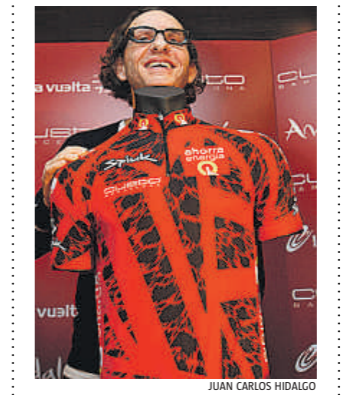
Custo posa con su nuevo diseño