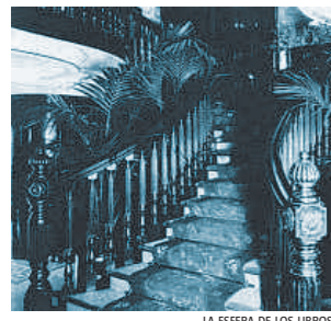
La escalinata en primera clase

Un lujoso transatlántico de principios del siglo XX se hundió de forma rápida y mueren la mayoría de las personas a bordo. Ese fue el fin del Titanic, pero también el del Príncipe de Asturias, un moderno buque de la compañía española Pinillos, que zarpó de Barcelona en dirección a Buenos Aires el 16 de febrero de 1916, y se hundió frente a las costas de Brasil el 5 de marzo, con 600 per-