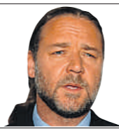
Russell Crowe actor 46