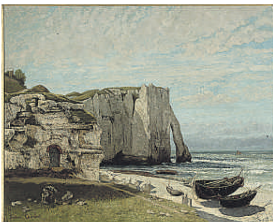
MUSÉE D'ORSAY / HERVÉ LEWANDOWSKI