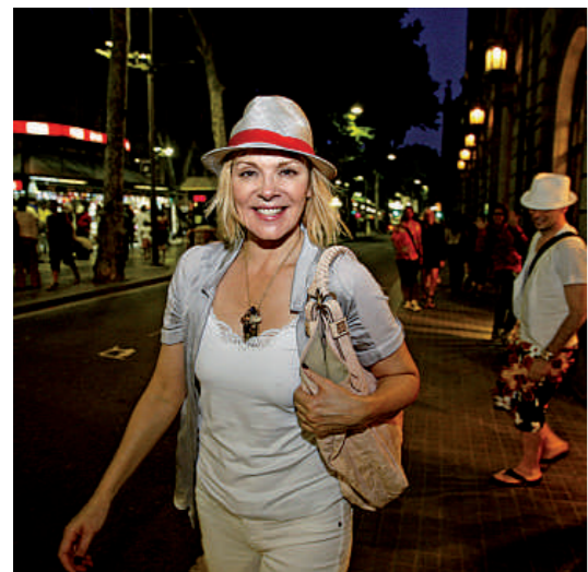
Kim Cattrall, el jueves por la noche en la Rambla

La actriz trabaja junto a Guillian Anderson y Matthew Macfadyen