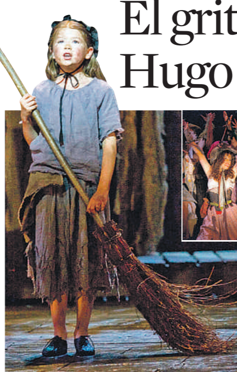
La obra. La novela de Victor Hugo se publicó en 1862 y es una de las más románticas y conocidas del siglo XIX. Es considerada como una defensa de los oprimidos. Victor Hugo mantuvo a lo largo de toda su vida una firme y total oposición a la pena de muerte

no habían creído en nosotros -recuerda Schönberg- y nos programaron entre Holiday on ice y el circo Gruss.