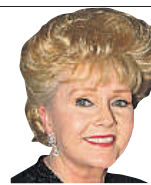
Debbie Reynolds actriz 78