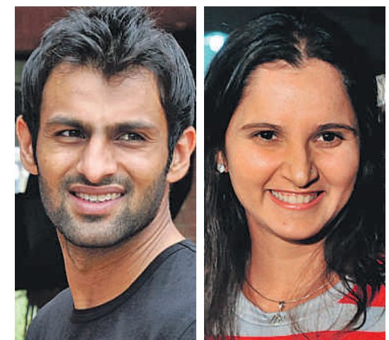
El críquetista pakistaní Shoaib Malik y la tenista india Sania Mirza