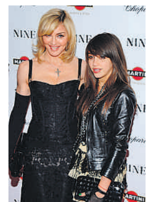
Así vestía Lola el pasado diciembre

En esta segunda incursión de Madonna en la industria de la moda, después de una colección que lanzó el 2007, la cantante delegó gran parte del esfuerzo creativo en su hija. "Saqué una línea para H&M, que me divirtió, pero fue mucho trabajo. Pensé que no quería dejar el resto de mis carreras, así que decidí que no iba a hacerlo de nuevo. Pero tengo una niña de 13 años llena de energía que quería hacerlo", explicó.