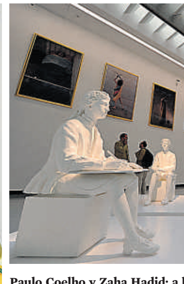
Paulo Coelho y Zaha Hadid; a