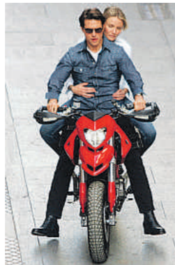
ALF / TARGET PRESS

El rodaje, que tuvo lugar en otoño, se prolongó más de lo previsto, lo que dio pie al flechazo entre la ciudad y el equipo. Cruise se dejó ver por las calles de Sevilla, en una de ellas con su hija Suri vestida de flamenca. La comedia de acción, dirigida por James Mangold, y en la que colabora Jordi Mollà, narra la persecución que sufre Díaz a raíz de desvelar un secreto. Tom Cruise es el agente que la acompaña en la huida. / V. Bejarano