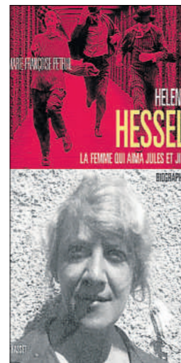
Arriba, Jeanne Moreau en el filme Jules et Jim ; abajo, la portada del libro