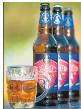
La nueva cerveza Kiss me Kate

La imagen muestra a la pareja en una instantánea obtenida por la agencia Reuters en Niue, un país en libre asociación con Nueva Zelanda. Mientras, en Nottingham, en el centro de Inglaterra, donde la leyenda sitúa a Robin Hood, la firma Castle Rock, que costumiza su cerveza con nombres ilustres, ha lanzado la Kiss me Kate en honor a la novia, Kate (Catherine). Kiss me Kate es el título de un musical clásico basado en La fierecilla domada de Shakespeare. / Redacción