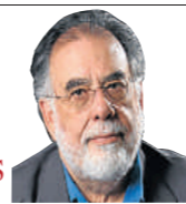
Francis Ford Coppola cineasta 72