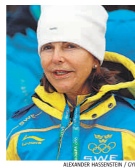
La reina Silvia en Vancouver

La reina Silvia de Suecia ha desmentido al tabloide Aftonbladet que padezca Alzheimer, como había afirmado en su blog un periodista de la revista Svensk Damtidning . "Estoy perfectamente, pero me preguntó cómo está el periodista que escribió eso", dijo la reina en declaraciones que ayer difundió el diario sueco. La esposa del rey Carlos Gustavo ironizó invitándole el próximo martes a la jornada que celebrarán en el Hogar de Silvia, una institución creada por ella en 1996 para ayudar a las personas que