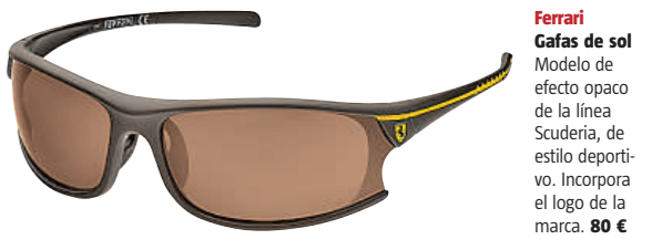
Ferrari Gafas de sol Modelo de efecto opaco de la línea Scuderia, de estilo deportivo. Incorpora el logo de la marca. 80 €

La fórmula 1 arranca este fin de semana. Entre todos los nombres destaca el binomio Ferrari-Fernando Alonso. La marca del cavalino rampante ha lanzado una colección de gafas