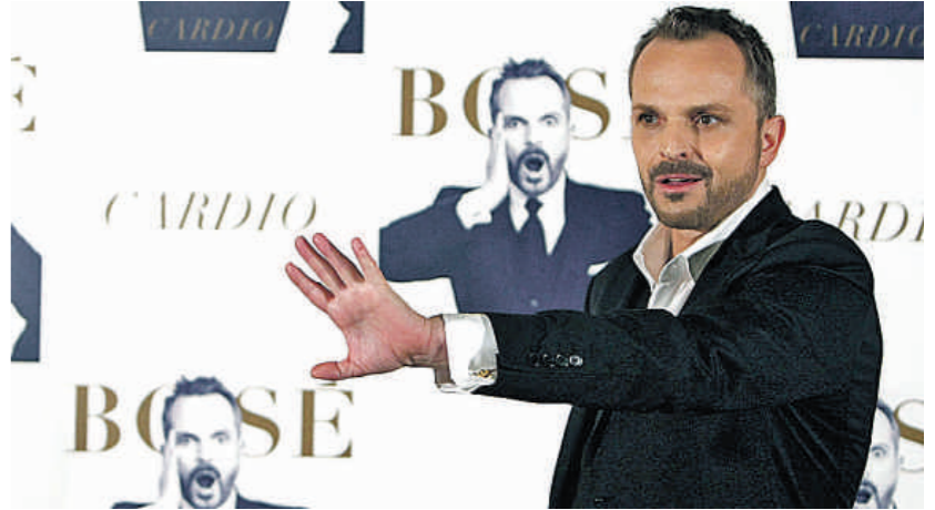
Miguel Bosé presentó el pasado lunes, en la Casa de América, en Madrid, su nuevo álbum Cardio

padecen distintos tipos de demencia. Uno de los motivos para crear la institución fue que su madre, Alice Sommerlath, padecía Alzheimer. El periodista había afirmado que la reina Silvia estaba "muy enferma", sufría Alzheimer y que empeoraba "con rapidez". La edición digital de Svensk Damtidning borró esa nota del blog del autor una hora y media después de haber sido difundida aunque rechazó cualquier tipo de responsabilidad sobre el contenido, aludiendo a que se trata de una página personal.