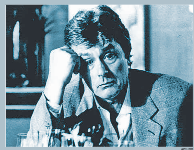
Jean Paul Belmondo . Godard, en el Festival de Cannes del 2001. Arriba, con Belmondo a quien dirigió en dos de sus filmes más emblemáticos, Pierrat le fou y À bout de souffle