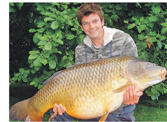
La carpa fue pescada en más de sesenta ocasiones

Miles de pescadores acudían a Northampton para hacerse la foto con la carpa 'Benson'