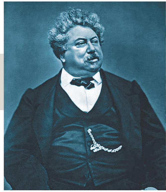
Racismo. Alexandre Dumas fue insultado por Honoré de Balzac por su color de piel. Gérard Depardieu encarna al autor de El conde de Montecristo en la película L'autre Dumas pero sin la piel oscurecida

El debate francés sobre la diversidad étnica se calienta al encarnar Gérard Depardieu, aunque con rizos, al escritor nieto de esclava