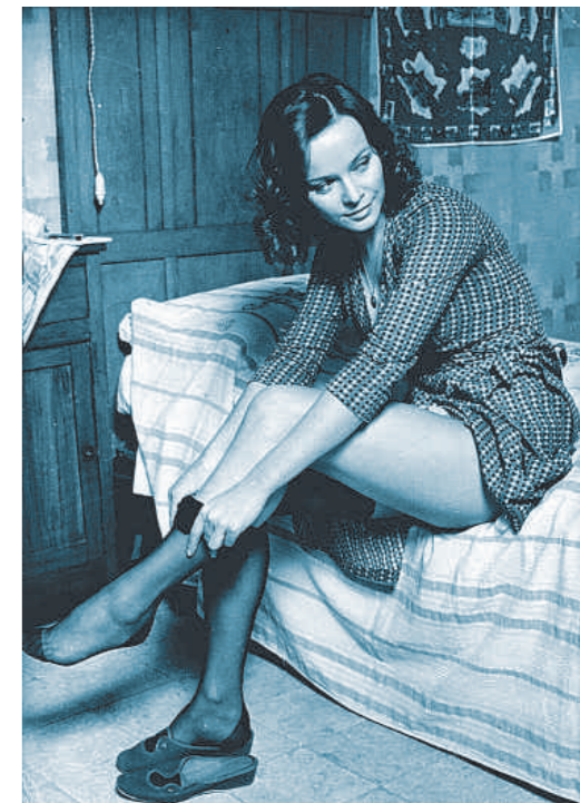
Laura Antonelli en Malizia , de Salvatore Samperi (1973)

"Me gustaría ser olvidada", dice la actriz, ex símbolo erótico, y rechaza la ayuda económica