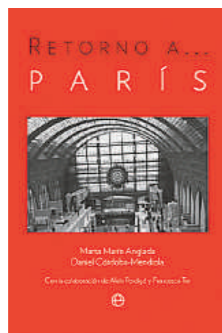
La esfera de los libros Colección de guías Regreso a... Estreno con París y Londres. 19,50 €