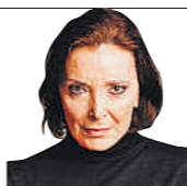
Nùria Espert actriz 75