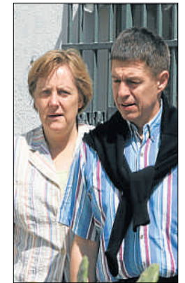
Angela Merkel, con su marido

lets y un resort de cinco estrellas. Además de pasar las vacaciones en un lugar discreto, darían trabajo a la población. Sin embargo, los altos gastos de seguridad y las infimas condiciones de vida de la población ocasionaron duras críticas de Parlamento. Motivo por el que los propietarios decidieron desprenderse de la propiedad. La decisión está tomada, pero sólo cuando reciban la obra podrán ponerla a la venta. Según informaba el NRC Handelsblad -diario liberal holandés- el pasado fin de semana, el portavoz de la casa real declaró: "El príncipe comunicará al presidente Marc Rutte el hecho cuando la mansión haya sido vendida". ●