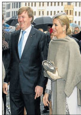
Los príncipes, el pasado día 14

Resurge la crítica a los herederos de la corona de la casa de Orange a pocos meses de entrega de la mansión entre dunas de Machangulo, junto al océano Índico, en Mozambique. El proyecto, del que participan otros amigos europeos de la pareja, comenzó el 2007 con la compra de los terrenos para construir cha-