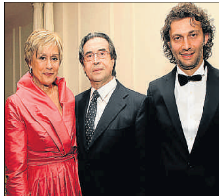
Kiri Te Kanawa, Riccardo Mutti y Jonas Kaufmann

"Tengo el aspecto de un pariente del Padrino", bromeó el director de orquesta Riccardo Mutti al recibir de manos de Francis Ford Coppola (director del filme homónimo) uno de los premios que da la revista Opera News . El acto se celebró el domingo en Nueva York. También fueron galardonados el tenor alemán Jonas Kaufmann, las sopranos Patricia Racette (estadounidense) y Kiri Te Kanawa (neozelandesa) y el bajo-barítono galés Bryn Terfel. / Ap