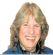
José Mercé cantor 56