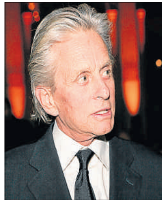
Michael Douglas acudió a la gala