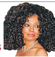
Diana Ross cantante 66