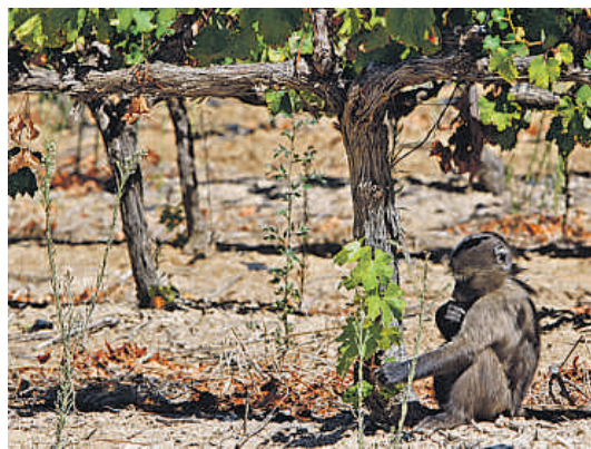
Un babuino en una viña de las afueras de Ciudad del Cabo