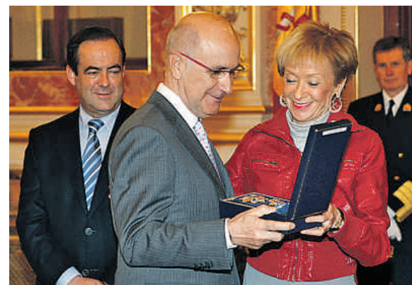
Fernández de la Vega hace entrega de la distinción a Duran Lleida