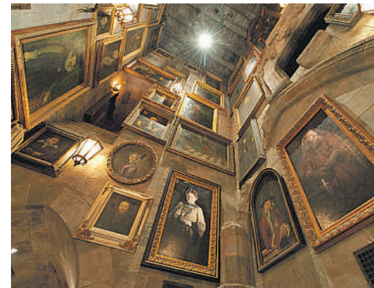
Retratos parlantes en las paredes del castillo de Hogwarts

Por ahora, la empresa sólo ha mostrado unas imágenes sobre qué es lo que le espera al visitante, pero ha confirmado que la nueva atracción utilizará una tecnología que incluye elementos físicos y proyecciones en 3D. Gracias a ella, los fanáticos de Harry Potter entrarán a la legendaria escuela de magia de Hogwarts para un tour que durará alrededor de una hora e incluye experiencias interactivas con los populares personajes de la historia.