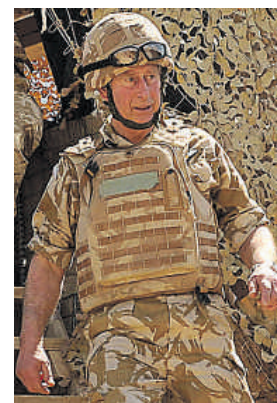
La foto fue tomada ayer