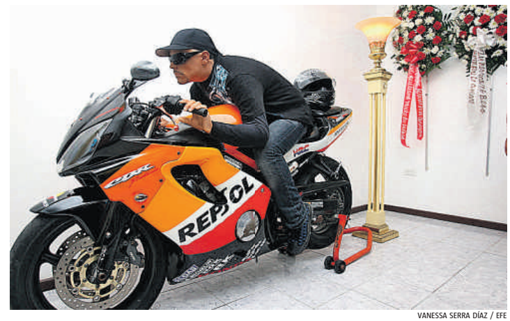
VANESSA SERRA DÍAZ / EFE

Artista y académico, Cardin reivindica estar “siempre en sintonía con la época” y constata, con una sonrisa: “Mis vestidos cortos, formas geométricas, botas altas, chaquetas sin cuello, todo lo que de 1960 a 1970 llevó mi firma y fundó el prêt-à-porter es popular medio siglo más tarde”.