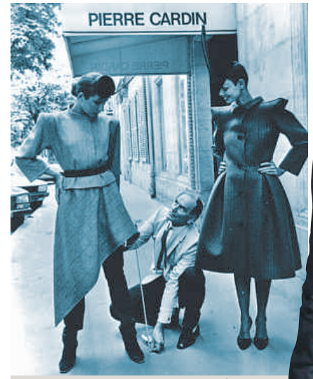
Arriba, en julio de 1979, Pierre Cardin bromea con la largura de la falda que lleva una de sus modelos. A la derecha aparece en una foto reciente

pace Cardin, ex teatro Ambassadeur, que dirige desde 1970: “Soy el más antiguo director de teatro de París”. En 1981 se quedó Maxim's, monumento de la belle époque en decadencia. Cardin compraba una marca: declinó Maxim's en flores, puros, sardinas, caviar. A su champagne le diseñó botella roja, tan escandalosa en su momento como el prêt-à-porter, su invento de hace cincuenta años con el que revolucionó el mundo de la alta costura.