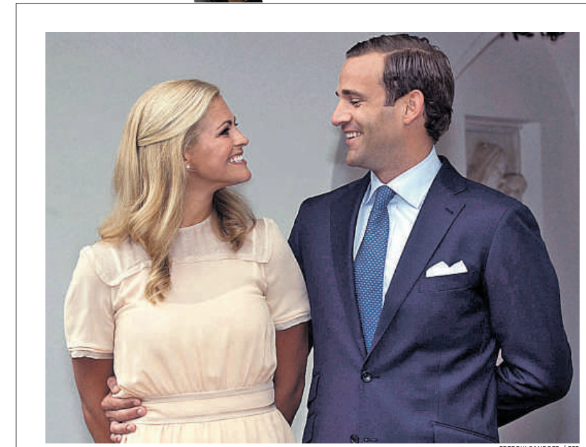
La princesa Magdalena de Suecia y su ex prometido, el día de su compromiso