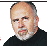
Jesús López Cobos dir. de orquesta 70