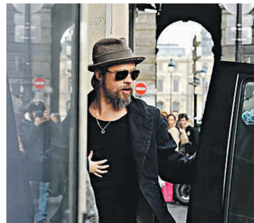
DOMINIQUE CHARRIAU / GY

Ahora en París, la actriz protagoniza 'The tourist' mientras su pareja cuida de la numerosa prole