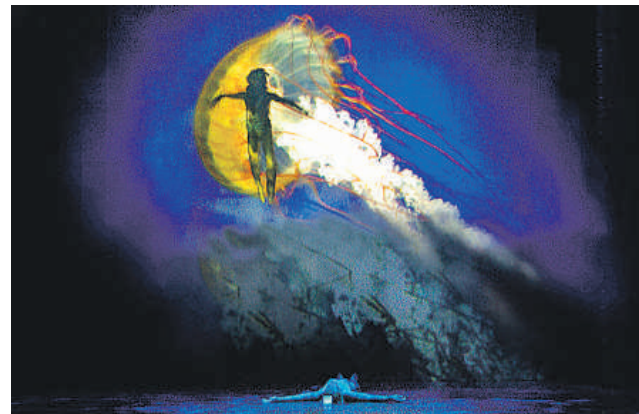
El musical A de Nacho Cano se representa desde hoy en el teatro Apolo

llones de euros, A cuenta con 40 artistas en el escenario entre actores, cantantes, bailarines y músicos –entre ellos el propio Cano, que ha compuesto los nuevos temas y que tocará al final de cada función un popurrí de canciones de su trayectoria– para dar vida a una fábula de tintes ecologistas y espirituales en las que se mezcla la desaparecida y sumergida Atlántida y el mundo actual, amenazado por la codicia y el desequilibrio con la naturaleza.●